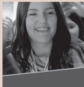
Motiverende læringsmiljøer -ny forståelse af motivation