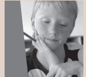
Tænk målstyret - i matematik