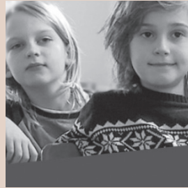
Kodning for alle