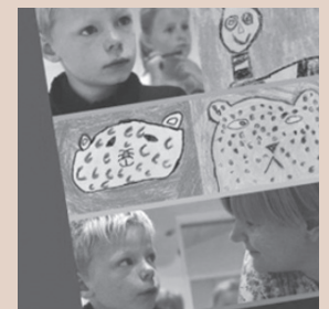
Inklusion i klassen -udvikling af lærerkompetencer